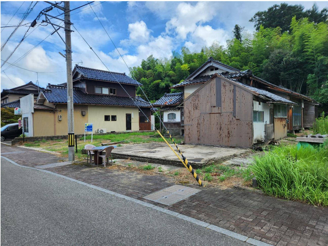
北西方向より撮影