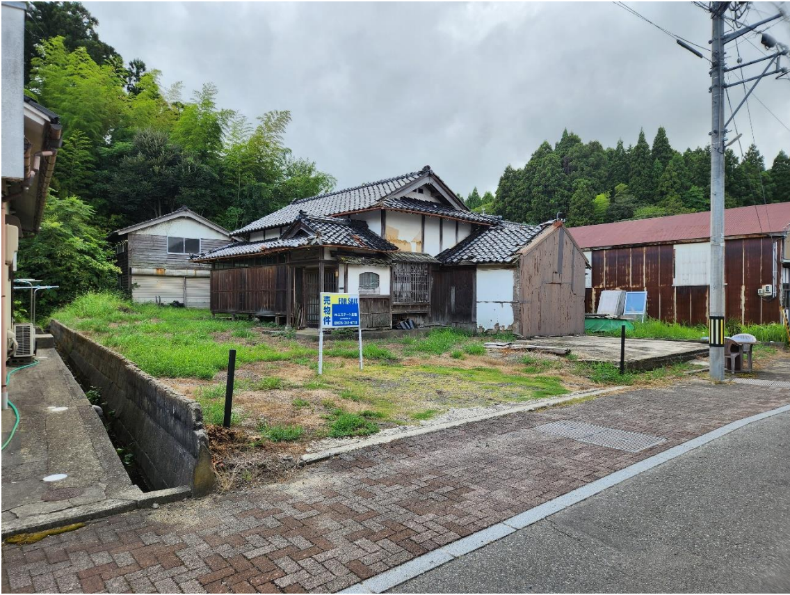
北東方向より撮影