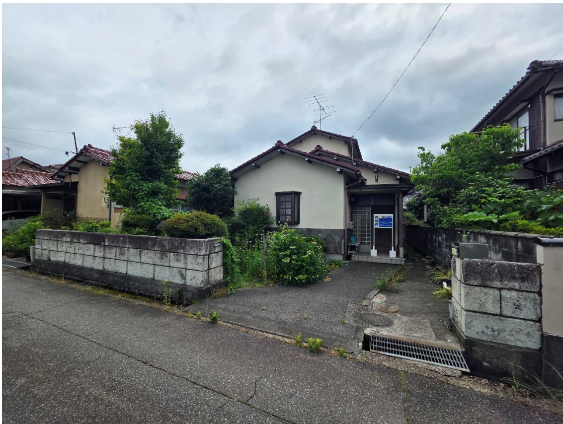
北東方向より撮影