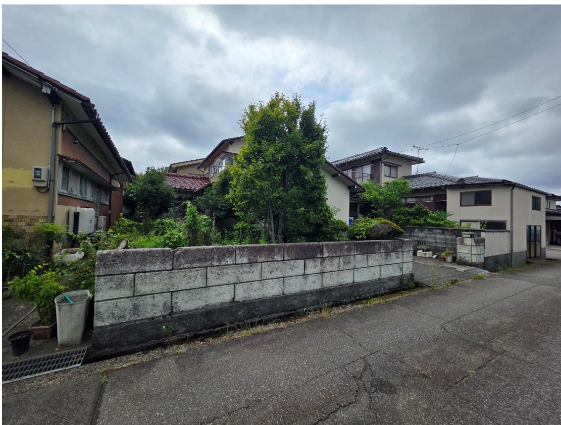
南東方向より撮影